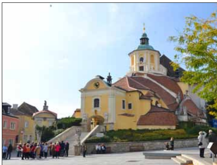
Kálvária templom Kismartonban

A Bazilika főoltárán található Máriát és a kis Jézust ábrázoló kegyszobor előtt mindannyian a Szűzanya segítségét kérve imádkoztunk, Mária lába elé