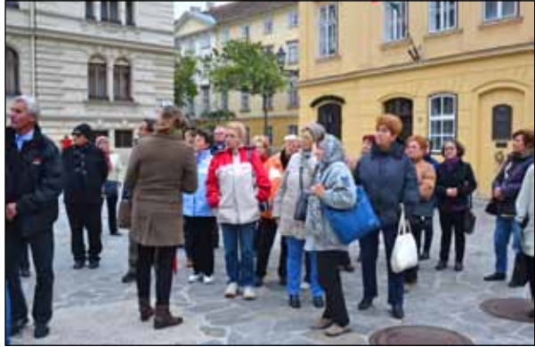
Zarándokcsoportunk néhány tagja

Itt található a Joseph Haydn mauzóleum is,