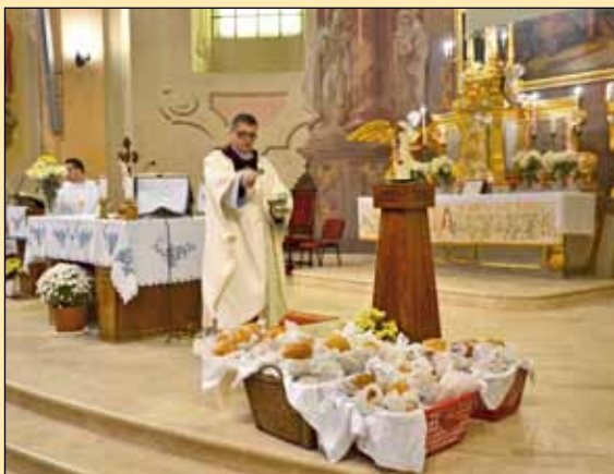
A kenyér megáldása