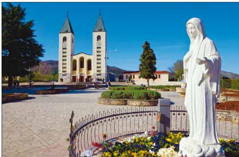
Medjugorje, Szent-Jakab templom