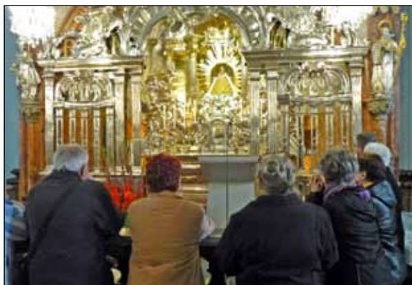
Szentmise a Boldogasszony oltárnál