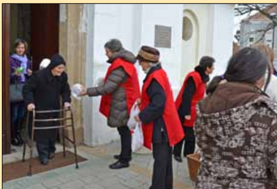
Mindenki örömmel fogadta Szent Erzsébet kenyérét