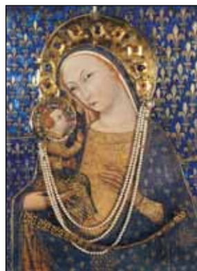
Kincstár-kép, 14. sz. (Nagy Lajos magyar király ajándéka)